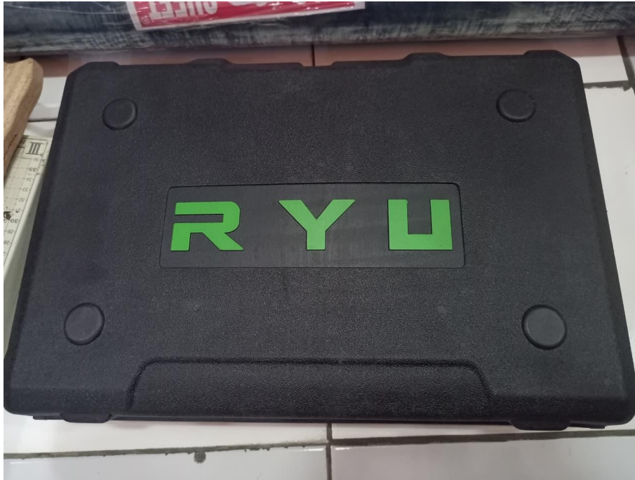
Gambar 5. Bor