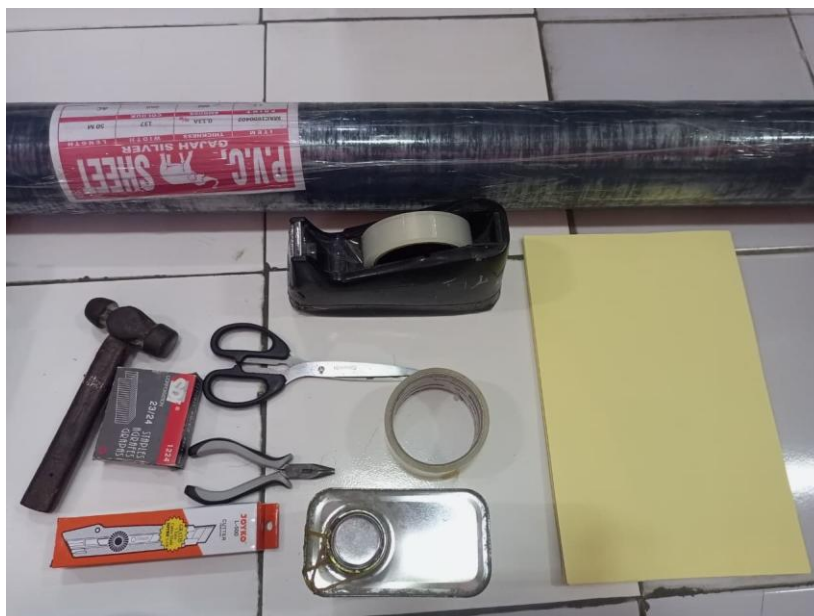
Gambar 4. Peralatan Perawatan dan Pelestarian Bahan Pustaka