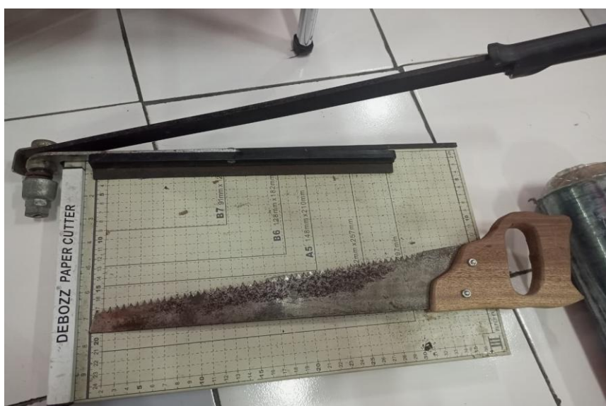
Gambar 2. Alat Pemotong Kertas