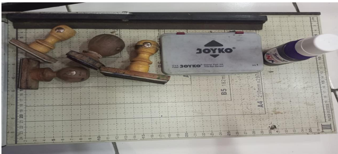
Gambar 3. Stempel, Tinta, dan Cap